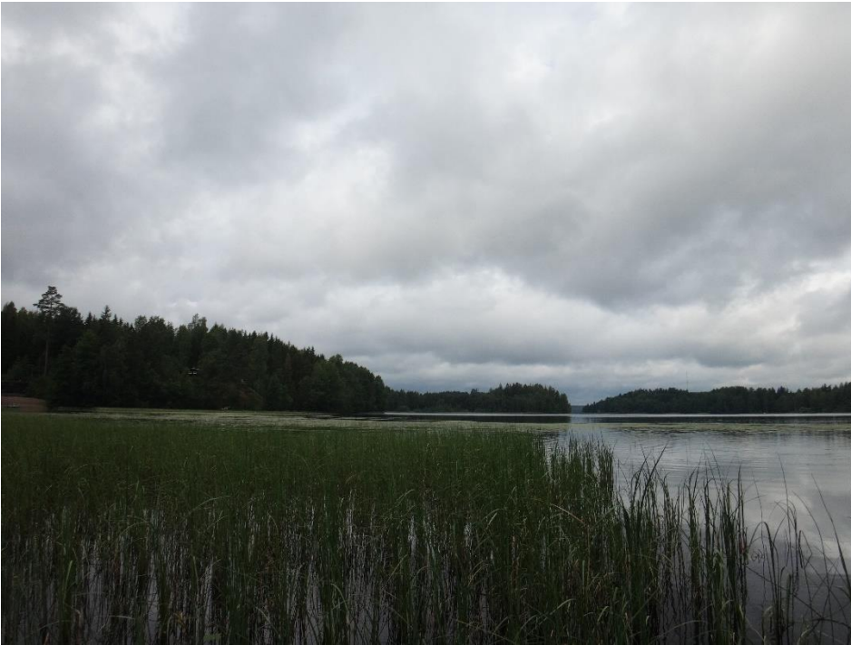
Kuva 2. Ylimmäinen heinäkuussa 2020.

Ylimmäisen happipitoisuus oli heinäkuussa 2020 pohjan läheisessä vedessä heikkenemään päin (2,1 mg/l, hapen kyllästys-% 18), välisyvytydessä 5 metrissä happipitoisuus oli 5,0 mg/l ja pintavesi oli hapekasta. Ravinnepitoisuuksien (kokonaisfosfori 21 µg/l ja kokonaistyppi 930 µg/l) perusteella Ylimmäinen on rehevä järvi, ja myös a-klorofyllipitoisuus (11 µg/l) vuonna 2020 ilmensi rehevyyttä. Pintaveden pH oli lievästi emäksinen (pH 7,3), pohjalla hieman happamampaa. Vuonna 2020 vesi oli selvästi humuspitoista (väriluku 150). Veden hygieeninen tila oli kesällä 2020 hyvä.