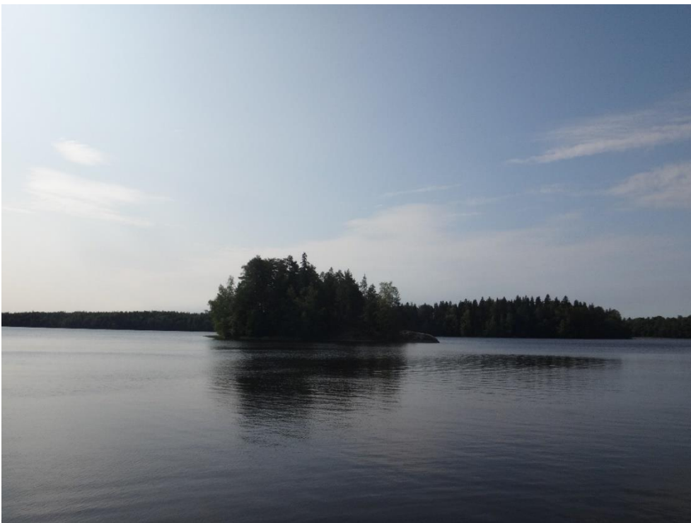
Kuva 2. Vihtijärvi kesällä 2019.

Hyvässä ekologisessa tilassa oleva, vähähumuksisten järvien tyyppiin kuuluva Vihtijärvi oli talven 2021 vedenlaatuanalyysien perusteella melko vähäravinteinen. Alusvedessä oli happivajautta ja veden väriluku ilmensi lievää keskimääräiseen humuspitoisuutta.