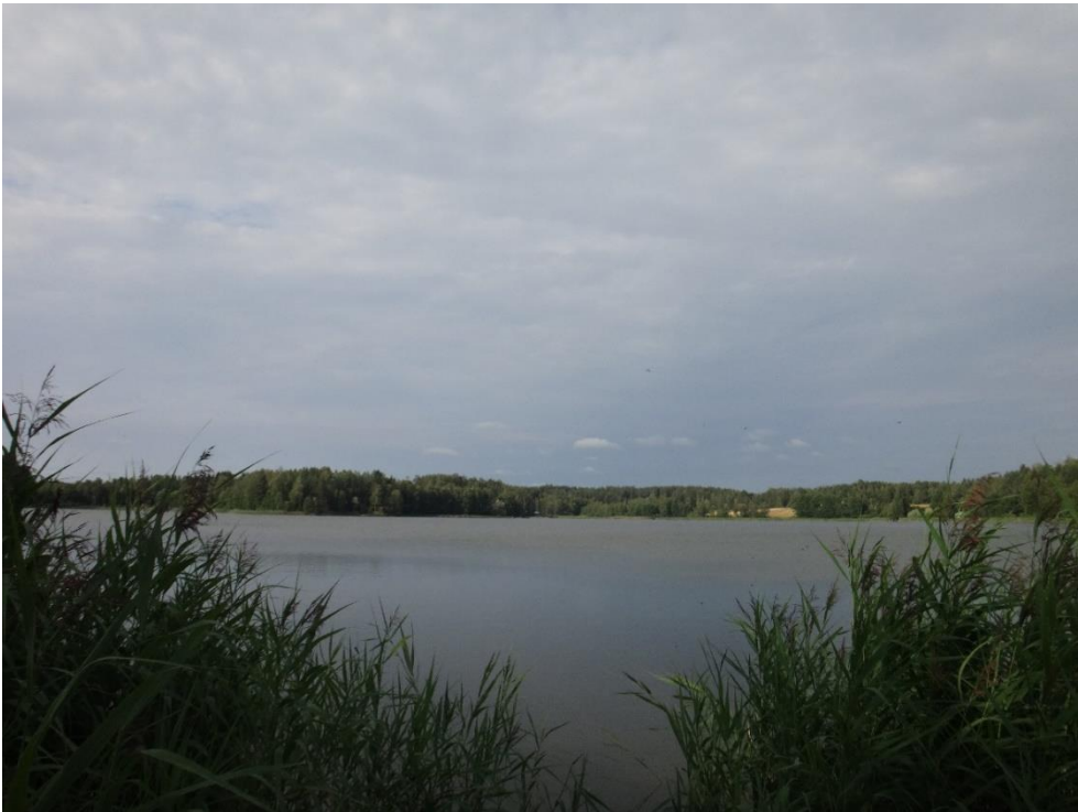
Kuva 2. Tervalampi kesällä 2019.

Välttävässä ekologisessa tilassa oleva, runsasravinteinen Tervalampi oli myös vuoden 2021 ravinnepitoisuuksien ja levätuotannon perusteella erittäin rehevä.