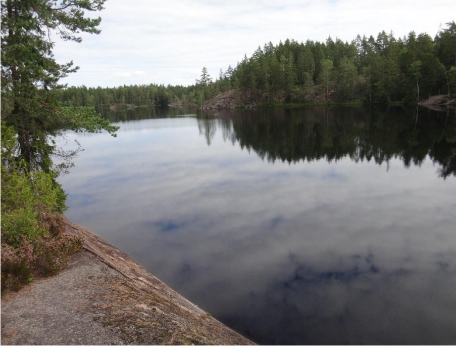
Kuva 2. Saaren Musta elokuussa 2020.

Saaren Mustan happipitoisuus oli elokuussa 2020 pohjan läheisessä vedessä välttävä (3,4 mg/l), pintavesi oli hapekasta. Ravinnepitoisuuksien perusteella Saaren Musta on karu järvi, ja myös a-klorofyllipitoisuus (3,4 µg/l) vuonna 2020 ilmensi samaa. Pintaveden pH oli hapan (pH 5,9), pohjalla hieman happamampaa. Järven alkaliniteetti on aiemmissa tutkimuksissa ollut erittäin huono, ja pH on ollut syksyisin 1990- ja 2000 -luvulla alhainen (noin pH 5). Vuonna 2020 vesi oli humuspitoista (väriluku 50). Veden suoloja mittaava sähkönjohtavuus oli lammessa pieni (<2 mS/m). Veden hygieeninen tila oli kesällä 2020 erinomainen.