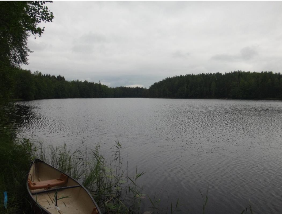
Kuva 2. Pyyslampi heinäkuussa 2020.

Pyyslammen happipitoisuus oli heinäkuussa 2020 pohjan läheisessä vedessä heikentymään päin (3,7 mg/l, hapen kyllästys-% 30). Ravinnepitoisuuksien (kokonaisfosfori 13 µg/l ja kokonaistyppeä 460 µg/l) perusteella Pyyslampi on lievästi rehevä järvi, myös a-klorofyllipitoisuus (11 µg/l) ilmensi vuonna 2020 lievää rehevyyttä. Pohjan heikentynyt happitilanne oli saanut aikaan mm. typpiravinteiden liukenemista pohjasedimentistä alusveteen. Pintaveden pH oli hapen (pH 6,2), pohjalla hieman happamampaa ja vesi oli selkeästi humuspi-toista (väriluku 150), mikä on tyypillistä järvelle, jossa on metsävaltainen valuma-alue. Veden hygieeninen tila oli bakteeritulosten perusteella kesällä 2020 erinomainen.