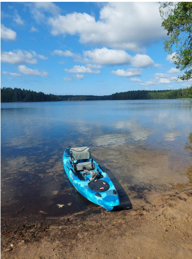
Kuva 2. Saarijärvi 7.8.2024.

Näytteenotosta vastasi Länsi-Uudenmaan vesi ja ympäristö ry:n sertifioitu ympäristönäytteenottaja (erikoistumisalueena vesinäytteenotto ja -mittaus). Laboratoriomäärityksistä vastasi LUVYLab Oy Ab. LUVYLab Oy Ab on FINAS-akkreditointipalvelun akkreditoima testauslaboratorio T147, akkreditointivaatimus SFS-EN ISO/IEC 17025: 2017. Akkreditoituun pätevyysalueeseen sisältyvä toiminta on nähtävissä verkkosivuilta www.finas.fi/toimijat . LUVYLab Oy Ab voi tarvittaessa lähettää näytteen tutkittavaksi hyväksymälleen alihankintalaboratoriolle, jonka tuloksista LUVYLab Oy Ab vastaa. Kaikki analyysit ovat akkreditoituja, lukuun ottamatta hapen kyllästysprosenttia, joka on laskennallinen. Akkreditoidut menetelmät on merkitty analyysitulosten määritysnimen edessä olevalla tähtimerkillä (*). Analyysitulokset ja kenttähavainnot on esitetty liitteessä 1 ja LUVYLab Oy Ab:n menetelmät ja määrittämissuoritukset liitteessä 2. Tulokset toimitetaan myös Suomen ympäristöhallinnon ylläpitämän tietojärjestelmä Hertan vedenlaatuosiointiin ja tiedot päivitetään www.vesientila.fi -sivuille.