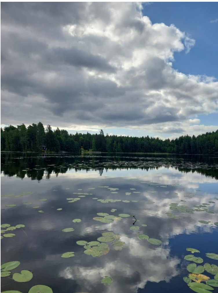
Kuva 2. Mylly-Majalampi 7.8.2024.

Näytteenotosta vastasi Länsi-Uudenmaan vesi ja ympäristö ry:n sertifioitu ympäristönäytteenottaja (erikoistumisalueen ala vesinäytteenotto ja -mittaus). Laboratoriomäärityksistä vastasi LUVYLab Oy Ab. LUVYLab Oy Ab on FINAS-akkreditointipalvelun akkreditoima testauslaboratorio T147, akkreditointivaatimus SFS-EN ISO/IEC 17025: 2017. Akkreditoituun pätevyyden alueeseen sisältyvä toiminta on nähtävissä verkkosivuilta www.finas.fi/toimijat . LUVYLab Oy Ab voi tarvittaessa lähettää näytteen tutkittavaksi hyväksymälleen alihankintalaboratoriolle, jonka tuloksista LUVYLab Oy Ab vastaa. Kaikki analyysit ovat akkreditoituja, lukuun ottamatta hapen kyllästysprosenttia, joka on laskennallinen. Akkreditoidut menetelmät on merkitty analyysitulosten määritysnimen edessä olevalla tähtimerkillä (*). Analyysitulokset ja kenttähavainnot on esitetty liitteessä 1 ja LUVYLab Oy Ab:n menetelmät ja määritysrajat liitteessä 2. Tulokset toimitetaan myös Suomen ympäristöhallinnon ylläpitämän tietojärjestelmä Hertan vedenlaatuosioon ja tiedot päivitetään www.vesientila.fi -sivuille.