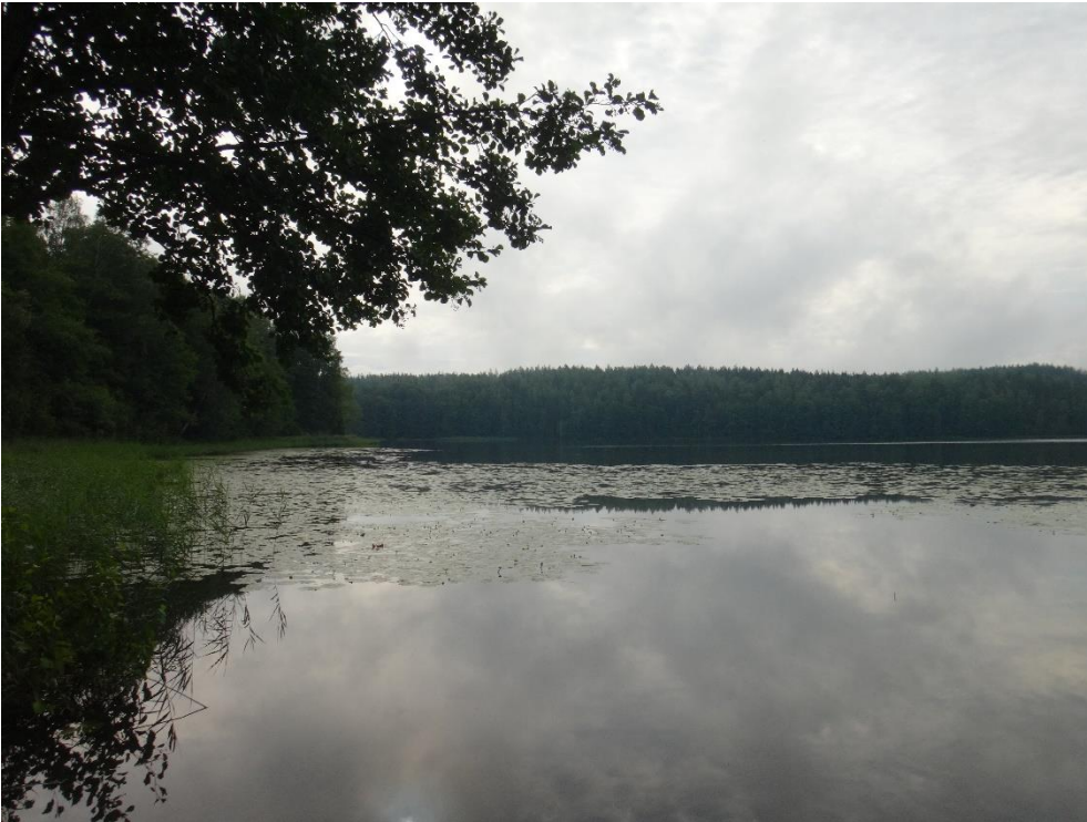
Kuva 2. Oravalanlampi heinäkuussa 2020.

Oravalanlammen happipitoisuus oli heinäkuussa 2020 pohjan läheisessä vedessä huono (0,9 mg/l, hapen kylästys-% 9). Ravinnepitoisuuksien (kokonaisfosfori 47 µg/l ja kokonaistyyppi 660 µg/l) perusteella Oravalanlampi on rehevä järvi, myös a-klorofyllipitoisuus (9,9 µg/l) ilmensi rehevyyttä. Pohjan heikko happitilanne oli aiheuttanut ravinteiden liukenemista pohjasedimentistä alusveteen ja pitoisuudet niin typpi- kuin fosforiravinteidenkin osalta olivat pohjan läheisessä vedessä pintavettä huomattavasti suuremmat. Pintaveden pH oli emäksinen (pH 7,4), pohjalla hieman happamampaa. Vuonna 2020 vesi oli jonkin verran humuspitoista (väriluku 50). Veden hygieneninen tila oli bakteeritulosten perusteella kesällä 2020 hyvä.