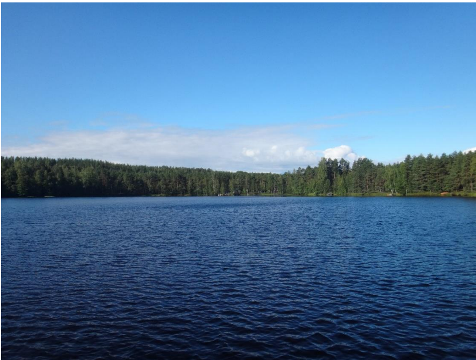
Kuva 2. Laihue 4.8.2021.

Elokuun 2021 vedenlaatuanalyysien perusteella Laihue oli lievästi rehevä, happamahko ja vahvasti humuspitoinen pieni järvi, jonka alusvedessä esiintyi happivajautta.