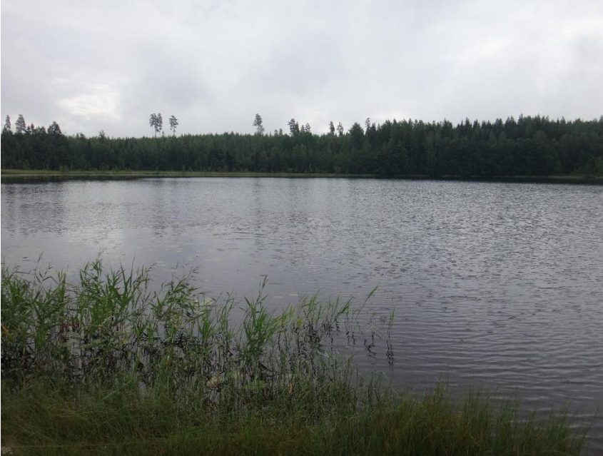
Kuva 2. Kurikanjärvi heinäkuussa 2020.

Kurikanjärven happipitoisuus oli heinäkuussa 2020 pohjan läheisessä vedessä 3 metrissä tyydyttävä (6 mg/l, hapen kyllästys-% 63). Ravinnepitoisuuksien (kokonaisfosfori 17 µg/l ja kokonaistyppeä 730 µg/l) perusteella Kurikanjärvi on lievästi rehevä järvi, myös a-klorofyllipitoisuus (9,2 µg/l) ilmensi vuonna 2020 lievää rehevyyttä. Pintaveden pH oli hieman emäksinen (pH 7,3) ja vesi oli humuspitoista (väriluku 80). Veden hygieeninen tila oli bakteeritulosten perusteella kesällä 2020 hyvä.