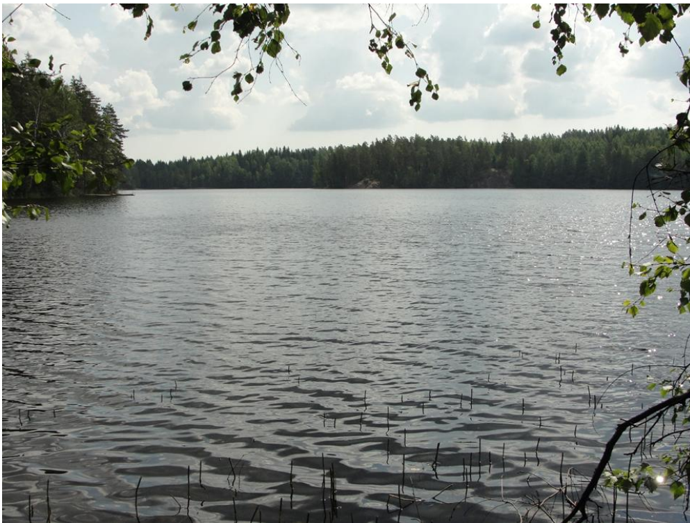
Kuva 2. Iso-Antias, Vihdin kunnassa, Nuuksion kansallispuistoalueella sijaitseva järvi.

Päällysvedessä alhaisesta levätuotannosta kertova klorofylli-a: oli alhainen, 3,2 µg/l. Myös kokonaisravinnepitoisuudet (fosfori ja typpi) olivat alhaisia (1 m: kokonaistyyppi 280 µg/l ja kokonaisfosfori 9 µg/l; 12,5 m: kokonaistyyppi 430 µg/l ja kokonaisfosfori 19 µg/l) ilmentäen karua vettä. Pohjan läheisyydessä ravinnepitoisuudet olivat hieman suuremmat kuin pintavedessä, mikä oli todennäköisesti seurausta heikentyneestä happitilanteesta ja sen aiheuttamasta ravinteiden vapautumisesta pohjasedimentistä alusveteen. Vesi on lievästi hapanta (pH 6,7). Veden hygieeninen tila oli erinomainen ( E. coli -bakteereja ei havaittu).