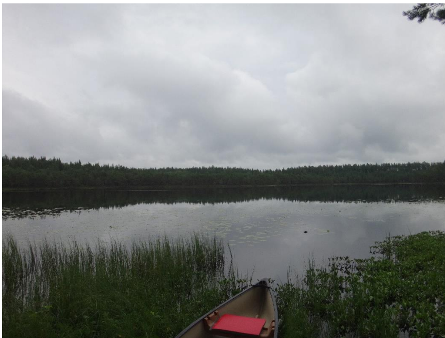
Kuva 2. Hiikkalammi heinäkuussa 2020.

Hiikkalammin happipitoisuus oli heinäkuussa 2020 pohjan läheisessä vedessä 4 metrissä huono (0,5 mg/l, hapen kyllästys-% 4). Ravinnepitoisuuksien (kokonaisfosfori 18 µg/l ja kokonaistyppi 520 µg/l) perusteella Hiikkalammi on lievästi rehevä järvi. Pohjan huono happitilanne ei ole kuitenkaan aiheuttanut ravinteiden liukenemista pohjasedimentistä alusveteen. Klorofylli-a-pitoisuus (30 µg/l) kertoo järven suurehkoista levä-tuotannosta heinäkuussa, mikä kertoo myös järven rehevyydestä. Järvi on erittäin hapan (pH 5,5) ja voimakkaasti humuspitoinen, mistä kertoo myös korkea väriluku (150) sekä kohonnut kemiallinen hapenkulutus (18 mg O 2 /l). Hiikkalammi on kärsinyt happamuusongelmista myös 2000-luvun alkupuolella. Veden hygieeninen tila oli bakteeritulosten perusteella kesällä 2020 hyvä.