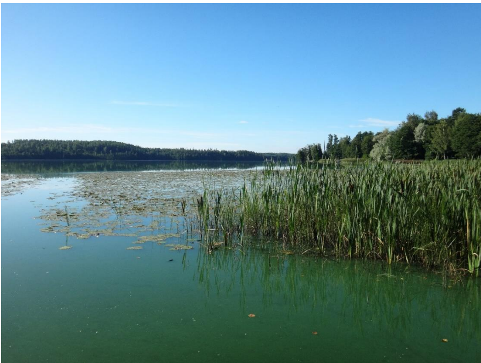
Kuva 2. Enäjärvi kesällä 2020.

Välttävissä ekologisessa tilassa oleva ja runsasravinteinen Enäjärvi oli myös vuoden 2021 vedenlaatuanalyysien perusteella erittäin rehevä ja leväkukinnot nostivat elokuussa pH:n hyvin korkeaksi (9,5). Havaintopaikan mataluus ja vesikerrosten pienet lämpötilaerot estivät pohjanläheisen täyden happikadon syntymisen.